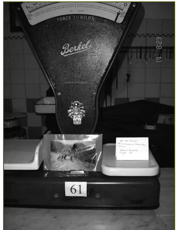
Leerlingen van het vijfde en zesde leerjaar plaatsen voorwerpen in het heemkundig museum De Drie Rozen die ze willen bewaren voor de toekomst.