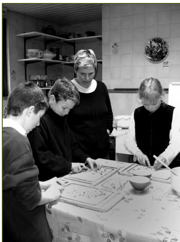
Vorbereidende erfgoeddagactiviteit van de Academie voor Streekgebonden Gastronomie